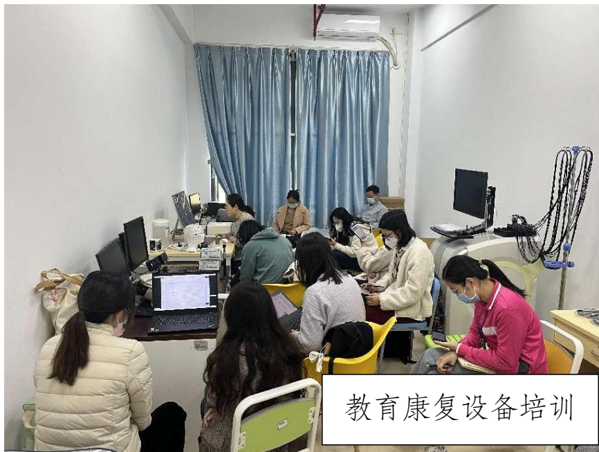
教育康复设备培训