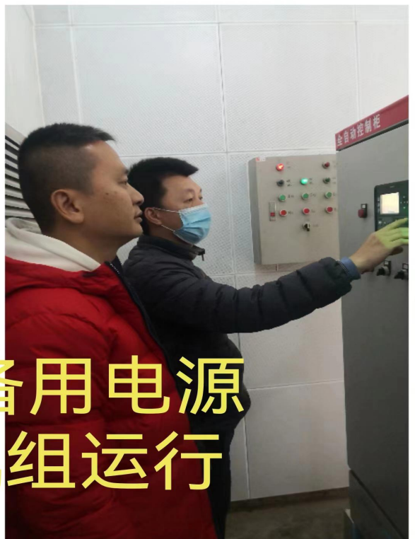
院2号备用电源 发电机组运行