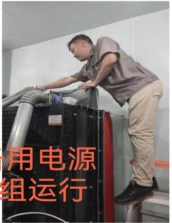
院1号备用电源 发电机组运行